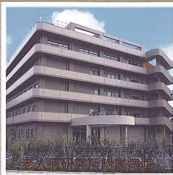
博慈会足立区竹の塚病院