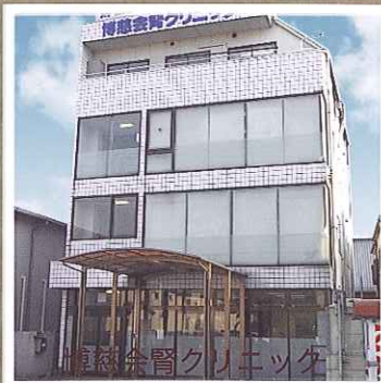
博慈会腎クリニック