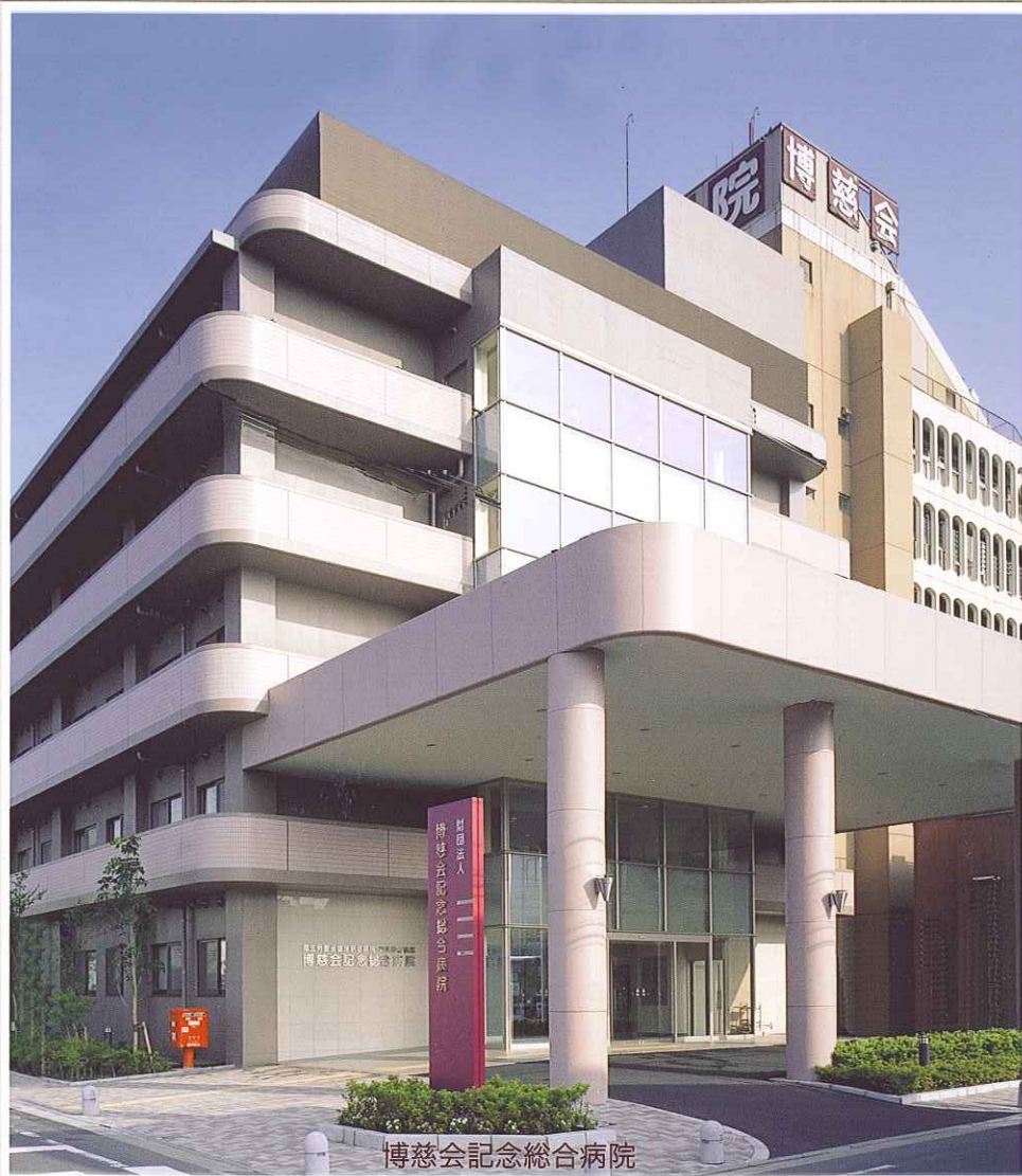
博慈会記念総合病院