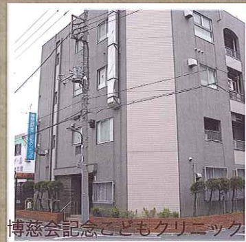
博慈会記念こどもクリニック