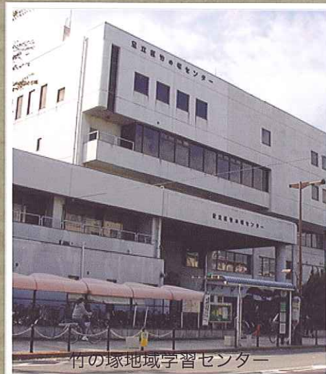
竹の塚地域学習センター