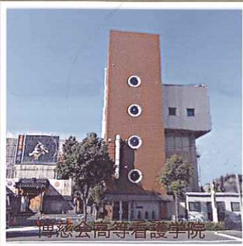
博慈会高等看護学院